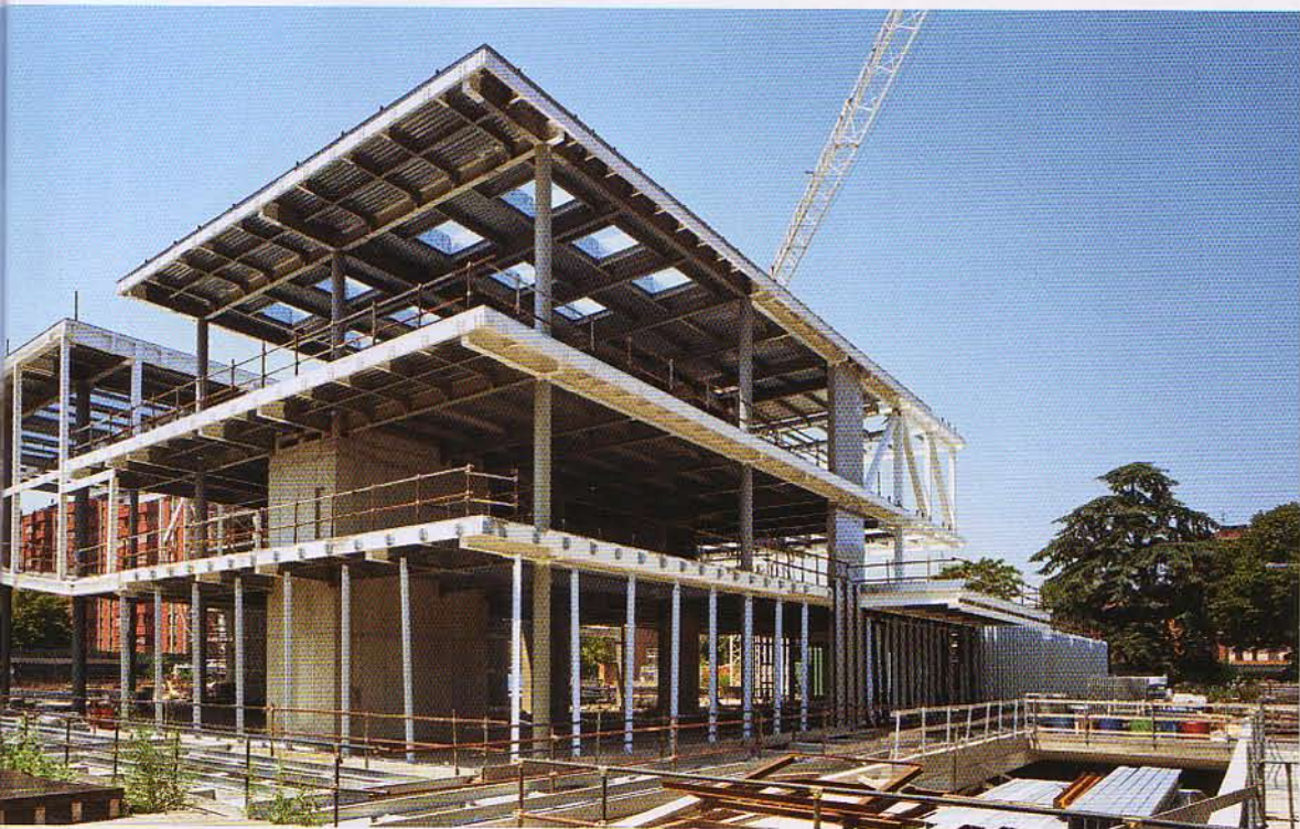
Work in progress